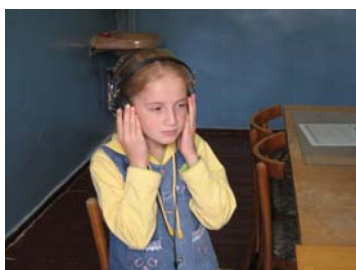
Elev vid skolan i Kutaisi hörseltestas

konventionell hörapparat som sådana som fått ett cochleaimplantat.