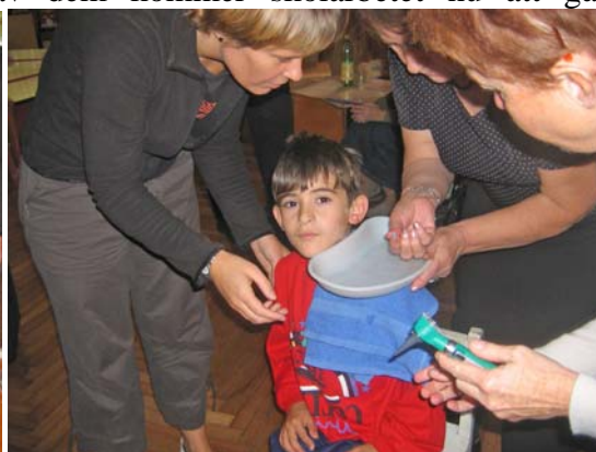
Vaxet i örat visade sig vara en plastbit, som måste tas bort före hörseltest och hörapparat.

betydligt lättare, efter det att de fått sin första hörapparat. Batumi har varken dövskola eller daghem/barnhem för hörselskadade/döva barn. Det visade sig senare att gravt hörselskadade barn från Batumi i stor utsträckning besöker internatskolorna i Tbilisi