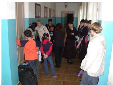
Väntande barn och föräldrar.

Så var vi åter i Tbilisi. Också i år började vi på barnhemmet, där vi blev varmt välkomna med en fin dansuppvisning av de små barnen. Barnen var verkligen duktiga och glada att få visa oss vad de kunde. Sen satte vi igång med hörselmätning, främst på de nya barn, och kontrollerade flertalet barn som fått hörapparat av oss föregående år. Några av dessa barn fick apparaterna utbytta och/eller nya proppar.