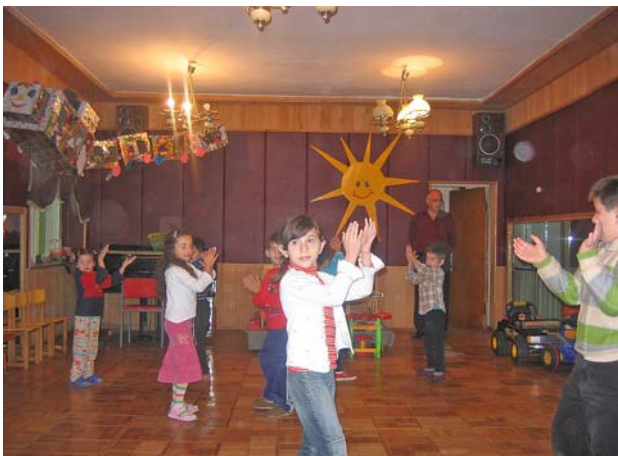
Dansuppvisning i barnhemmet

resp. Kutaisi. Skolan i Kutaisi låg på återvägen till Tbilisi, så där stannade vi 2 dagar, gjorde hörselmätningar och avtryck och lovade att om en dryg vecka återkomma med hörapparater och individuella proppar.