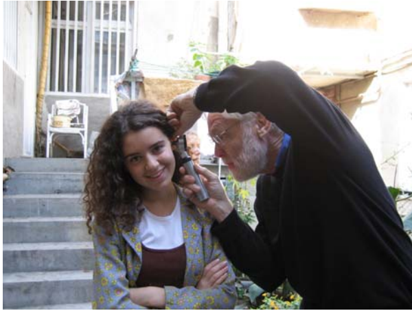
Öronundersökning utanför bostaden.

kunna fortsätta vårt arbete att hjälpa hörselskadade barn i Georgien att få hörapparater och individuella proppar.